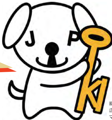
総務省 広報用キャラクター マイキーくん

マイナンバーカードは、 平成28年1月から 発行を開始し、今年で 3年がたちました！