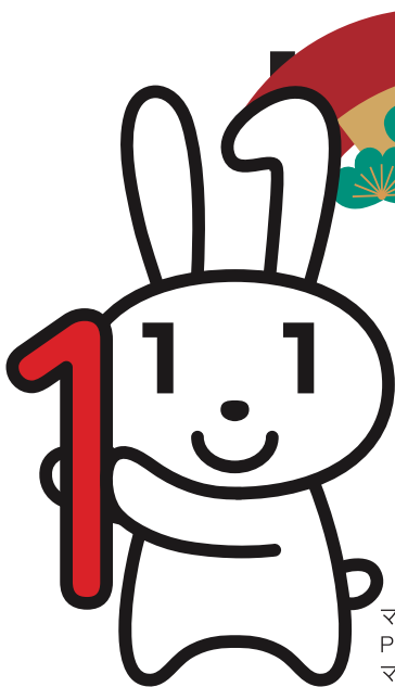
マイナンバー PRキャラクター マイナちゃん