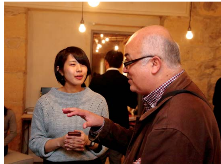
フランス・パリにて現地バイヤーとの意見交換