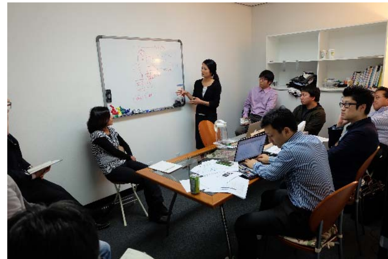
アメリカ・ロサンゼルスにて、 研修生が米国進出を希望する民間企業・OJT受入先と議論