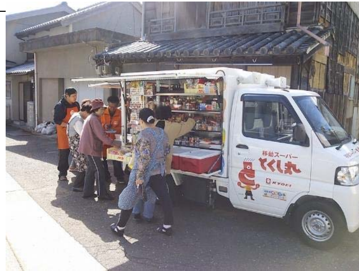
全国 移動スーパーとくし丸