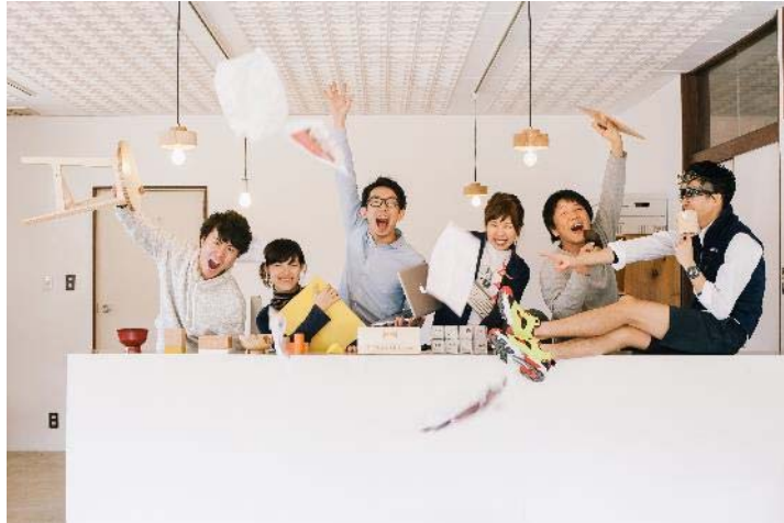
福井県鯖江市 産地特化型のデザイン事務所「TSUGI」