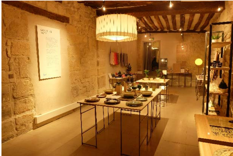
フランス・パリに展示する伝統工芸品の検討・展示