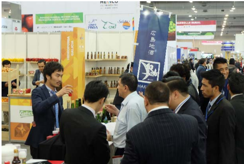
メキシコ最大級の食の展示会にて、 広島県呉市の酒・味噌を紹介