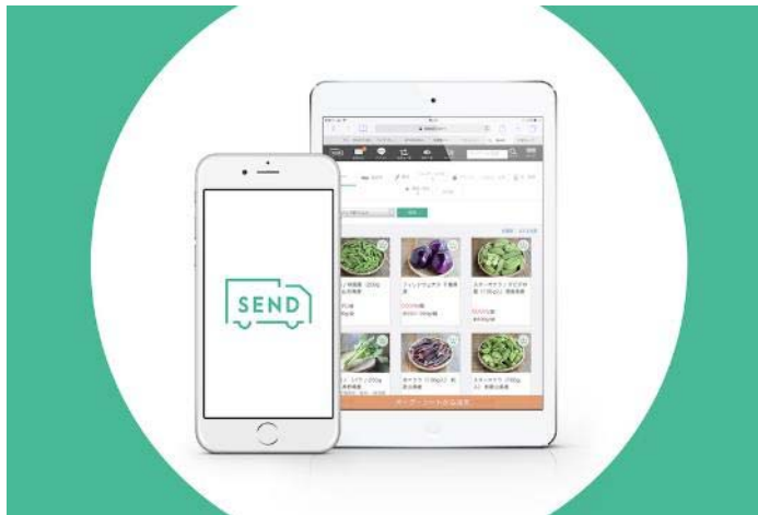
全国 生産者支援プラットフォーム「SEND」