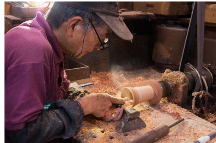
徳島県神山町 神山しずくプロジェクト