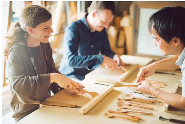
富山県南砺市 職人に弟子入りできる宿「BED AND CRAFT」