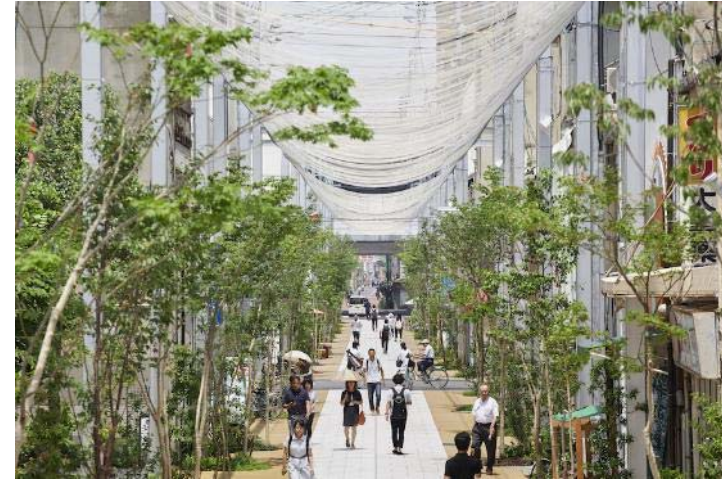
広島県福山市 福山市本通・船町商店街アーケード改修プロジェクト