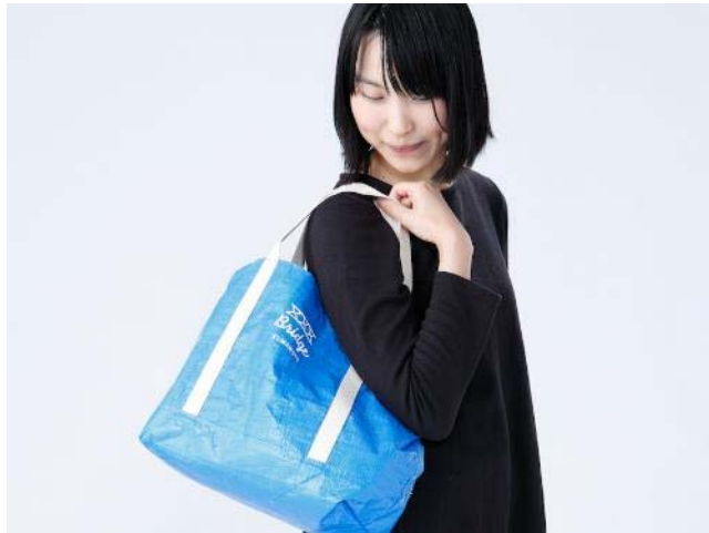
熊本県熊本市 ブルーシードバッグ・プロジェクト