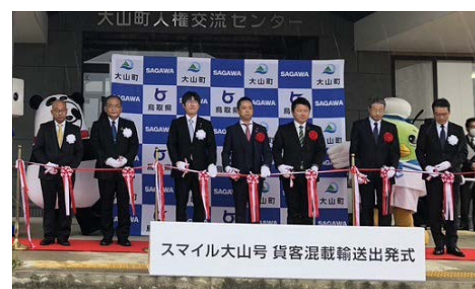
▲貨客混載輸送出発式の様子。