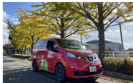
▲鳥取県大山町が運営する「スマイル大山号」。

デマンドバスを運行するのは、町内唯一のタクシー会社である有限会社日興タクシーで、佐川急便（株）米子営業所（鳥取県米子市）からトラックで運び込んだ荷物をデマンドバスに積み替えて配達している。