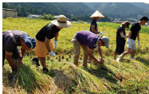
農林業体験を行う宿泊者の様子