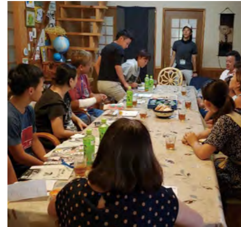
移住ツアーの様子(移住者が開業する農林業体験民宿における参加者との意見交換会)