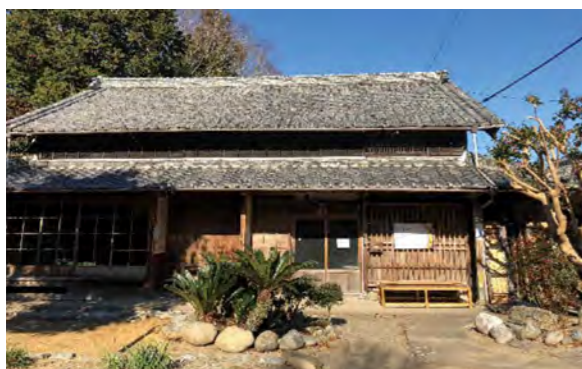
空家を活用した農林業体験民宿

●提案を踏まえた国からの制度改正以降、農林漁業者に限らず、多様な主体が自宅の一部や古民家・空家等を活用し、都市住民等に対して多種多様な農林漁業体験の機会を提供することで、滞在の拠点として機能し、農山漁村の活性化につながっている。近年は、海外からの修学旅行の受入れや訪日外国人観光客も増加している。さらに、市町が実施する移住ツアーに協力するなど移住に関心のある都市住民の受入れも進んでいる。