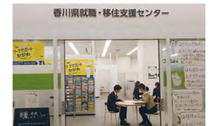
地元定着を希望する学生等が相談に訪れる香川県就職・移住支援センター（ワークサポートかがわ）

香川県の提案で実現した奨学金活用枠の拡大はこの取組を確実に加速させるものと心強く思っております。