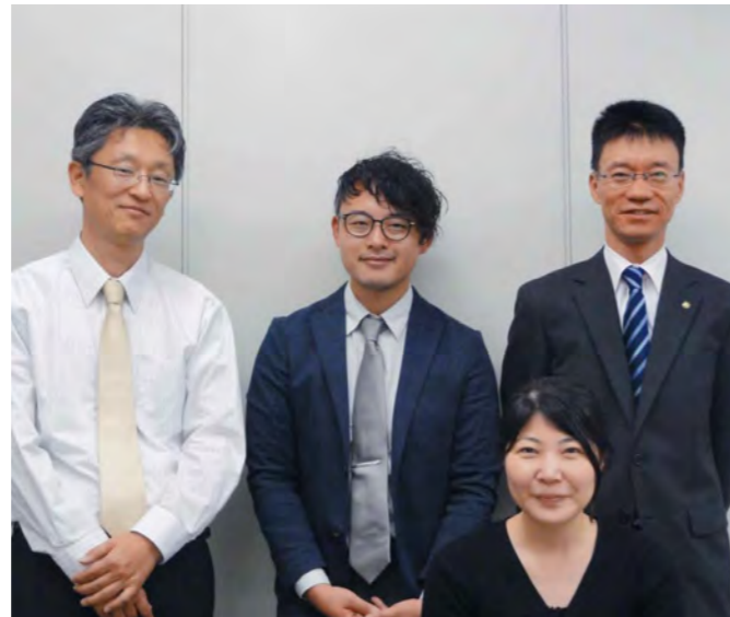
関係者の声 香川県政策部政策課奨学金担当のみなさん

香川県では、意欲や能力が高く、卒業後に県内に就職・定着し、県の成長エンジンになる6分野（食品・バイオ、健康、先端・基盤技術、エネルギー・環境、農産物、観光）を担う人材と成り得る方を支援しています。日本学生支援機構の無利子奨学金が優先的に貸与されるよう推薦を行うとともに、卒業後の県内での定住、就業等の条件を満たした場合、無利子奨学金返還時にその返還額の一部支援を行い、がんばる人を応援しています。