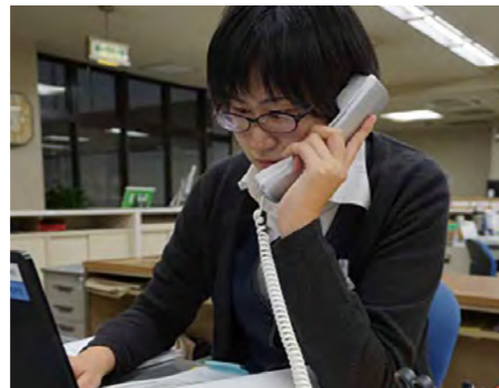
地元で根付き、将来を担う人材は地域の宝