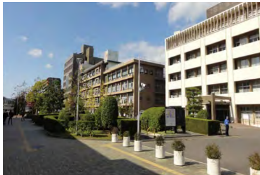
予約採用者が通う大学