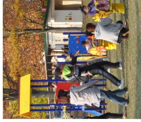
人々のレクリエーションの空間