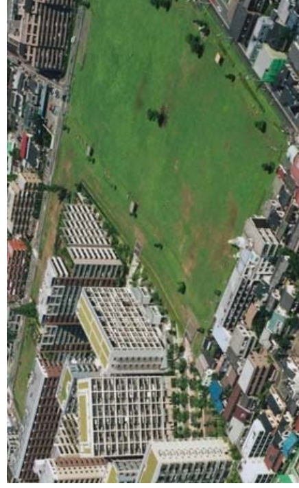
都市の防災性の向上