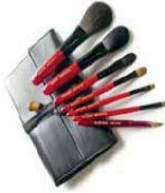
国民栄誉賞の副賞として「なでしこジャパン」に贈られた化粧ブラシ