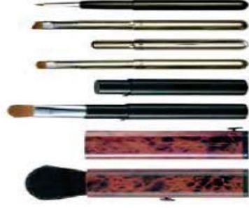
携帯用化粧ブラシ