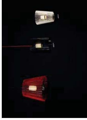
上海にある大手コーヒー店の照明に採用された「MOTO」