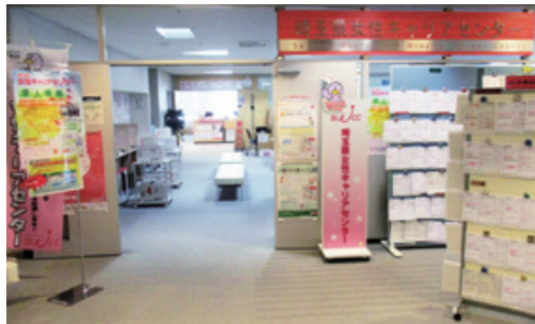
埼玉県女性キャリアセンター入口