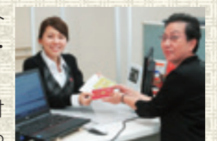
パスポート交付で独自の取組が評価されている「コア・よか」