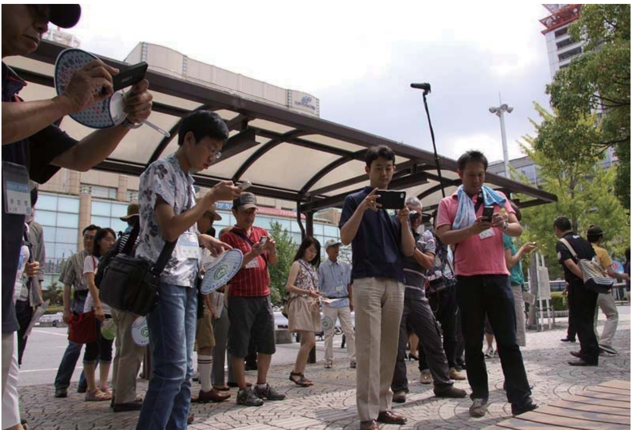
実証実験時のイベントの様子（平成25年8月）

平成25年、スマートフォン等のGPS機能やカメラ機能の活用によって、地域で発生している様々な課題について、市民と市役所が協働して解決を目指す「ちば市民協働レポート」の実証実験を実施。住民のまちづくりへの参加意識の醸成にもつながっており、今後の本格実施に向け、注目を集めている。