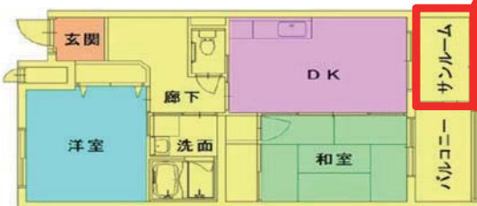
サンルームが設置された間取り例

平成26年度に建替えに着手する住宅（28戸）においてもサンルーム型物干場を設置することとしており、地域の実情に合った公営住宅の整備を進めることで、公営住宅入居者の居住の快適性の向上につながるとともに、湿気・結露・カビ発生の予防を通じた居室の長寿命化を図ることができ、将来にわたって良質な住居を維持することができる。