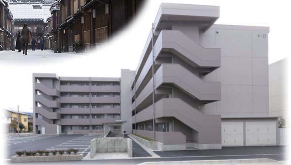
雪景色の「ひがし茶屋街」（重要伝統的建造物群保存地区）と市営住宅