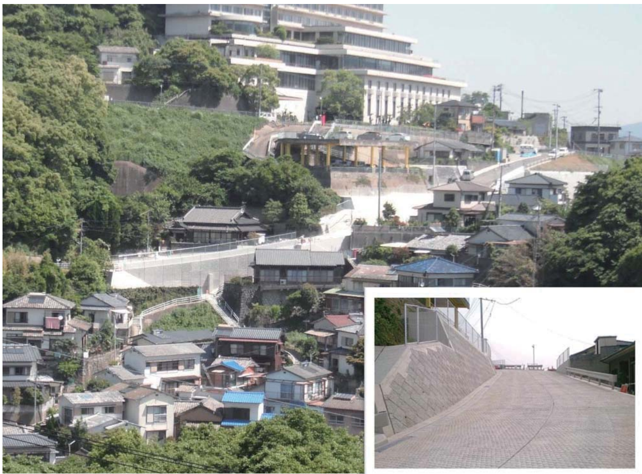
新たな基準で整備された市道大鳥町大谷町1号線（延長79m、縦断勾配最大16.889%）

そこで、平成24年10月、「長崎市市道の構造の技術的基準を定める条例」を制定し、国の基準よりも急勾配の道路を整備できるよう独自の道路構造基準を策定した。