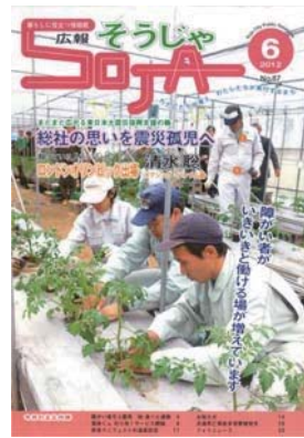
市の「広報そうじゃ」で 障がい者雇用について広報