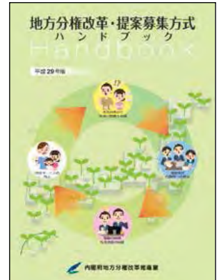
提案募集方式 ハンドブック