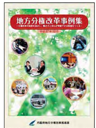
地方分権改革 事例集