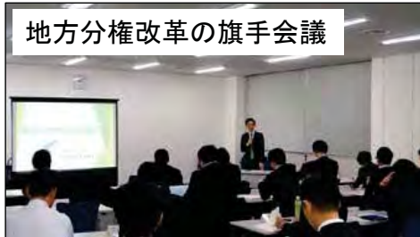
地方分権改革の旗手会議