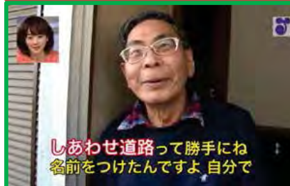
しあわせ道路って勝手にね 名前をつけたんですよ、自分で