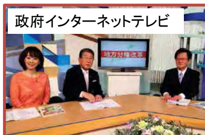
政府インターネットテレビ