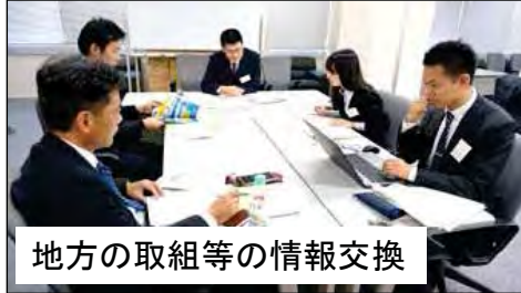
地方の取組等の情報交換