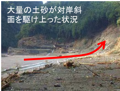
大量の土砂が対岸斜面を駆け上った状況