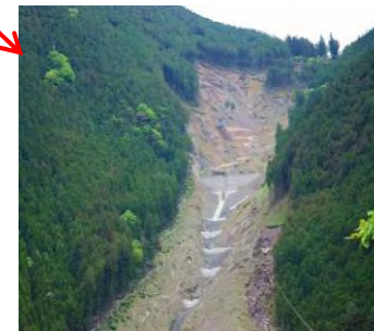
崩壊地の復旧状況