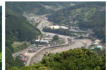
下流保全対象 なかちょう さかしゅう (那珂町坂州)