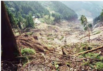
崩壊地源頭部状況