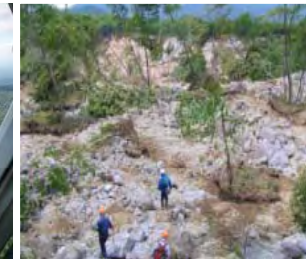
↑治山技術者、専門家による 現地調査