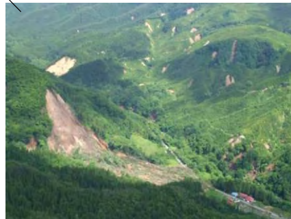
くりはらし どうまん 宮城県栗原市(洞万)