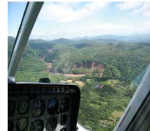
↑ヘリコプターによる緊急調査