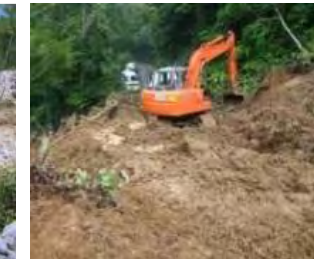
↑国道の迂回路として活用 するための林道整備

ヘリコプター等による緊急調査、2次災害防止のための土石流センサー等の設置、国有林林道の国道迂回路への活用等の応急対策の実施