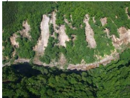
くりはらし ぬるゆ 宮城県栗原市(湯温)