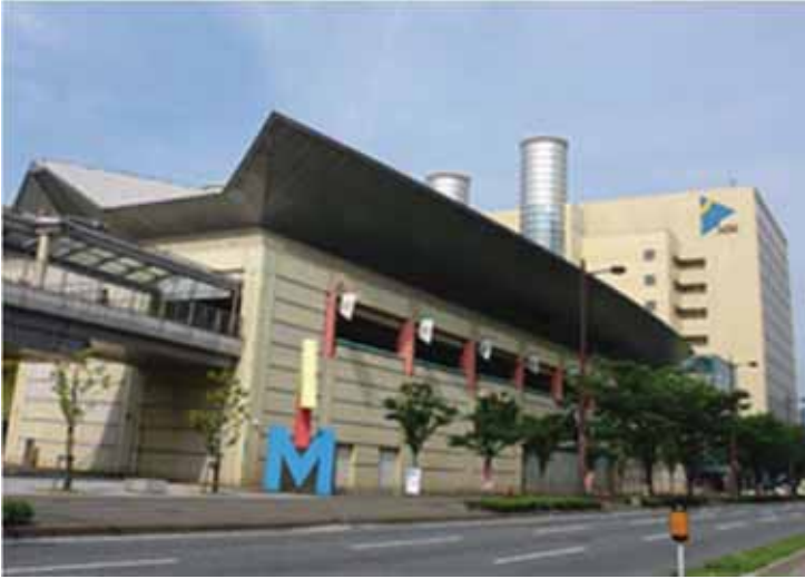
若者ワークプラザが テナントとして入っている AIMビル