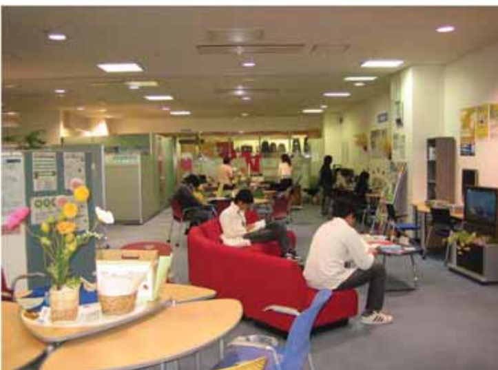
若者ワークプラザ北九州 室内