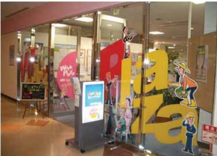
若者ワークプラザ北九州 入口付近