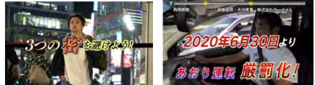
政府インターネットテレビ

政府の重要政策に関する情報を国民に提供しその理解を求めるとともに、国民生活に不可欠な情報を提供するため、内閣官房や各省庁と連携した戦略的な広報を展開しています。