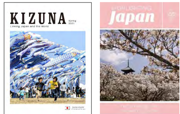
「KIZUNA」（2021年春号）（左） 「HIGHLIGHTING Japan」（2020年4月号）（右）

我が国に対する国際社会の理解の浸透を図るため、日本の強みや魅力を戦略的に発信します。