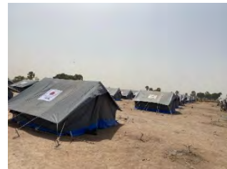
設営されたテント