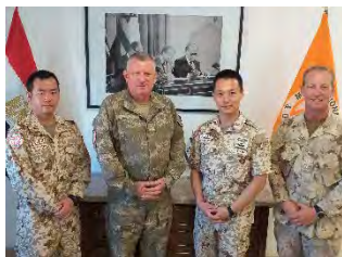
司令部要員の様子

2 名の司令部要員は、シャルム・エル・シェイク（エジプトのシナイ半島）の MFO 司令部において、エジプト及びイスラエルの政府その他の関係機関と MFO との間の連絡調整の業務を行っています。