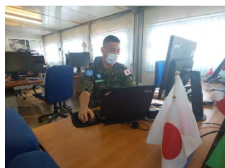
司令部要員の様子