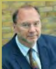
第2回野口英世アフリカ賞受賞者 医学研究部門 ピーター・ピオット博士