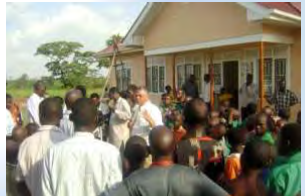
HIV センターを立ち上げた日、多くの村人と共に