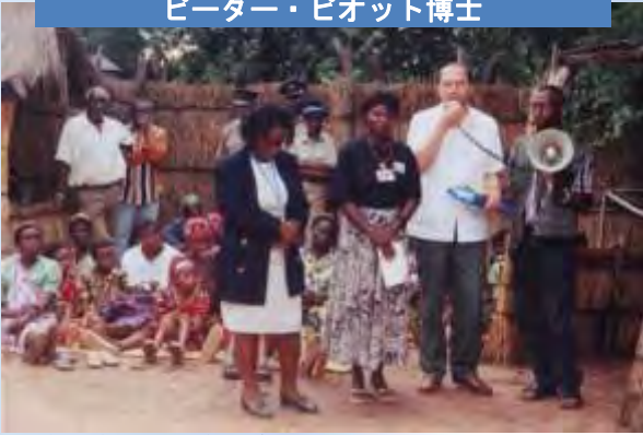
ザンビアのリビングストンのコミュニティーにて