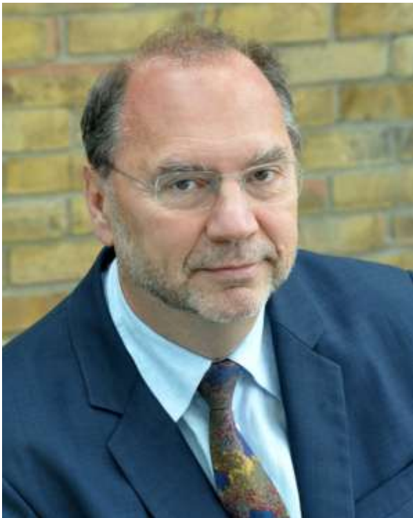
医学研究部門 ピーター・ピオット博士 (ベルギー) ロンドン大学衛生・熱帯医学大学院学長

医学研究部門・ピーター・ピオット博士 医療活動部門・アレックス・コウティーニョ博士