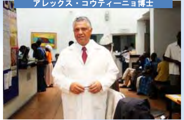
マケレレ大学感染症研究所（ウガンダ）の HIV 診療科にて