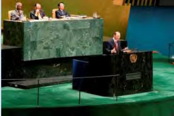
国連エイズ合同計画（UNAIDS）事務局長として、国連総会で演説