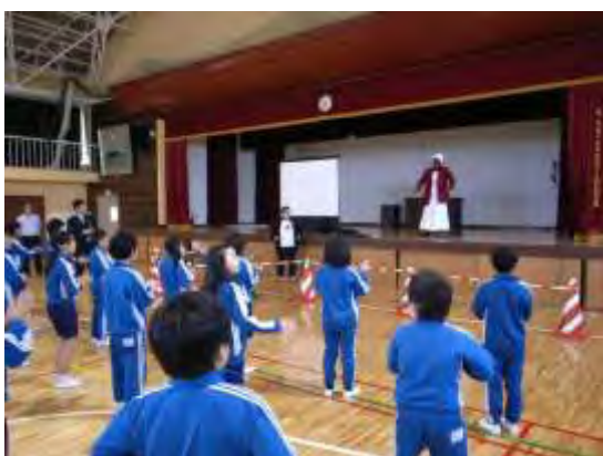
ウエレ博士と子供達