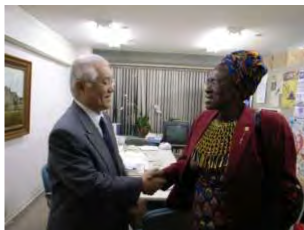
武見 敬三 東海大学教授と