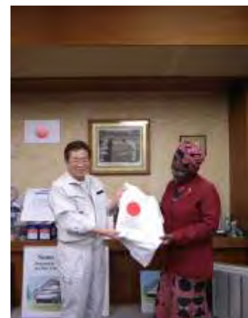
立谷 秀清 相馬市長とウェレ博士

猪苗代町を後にしたウェレ博士一行は、相馬市役所を訪れ、立谷 秀清 相馬市長を表敬訪問しました。ウェレ博士は東日本大震災で被害にあわれた相馬市、そして被災者の方々にお見舞いの意を表し、KIZUNA Tシャツを贈呈しました。立谷市長は震災や震災後の市民の生活、相馬市独自の震災遺児のための育英基金などの取り組みについて説明をしました。