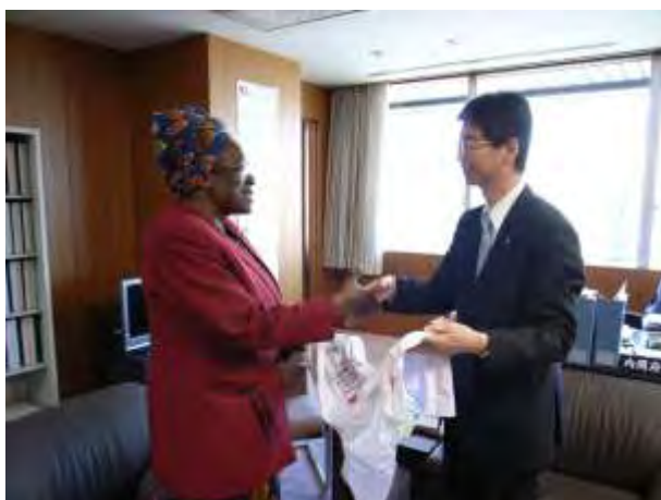
内閣府 園田 康博政務官と