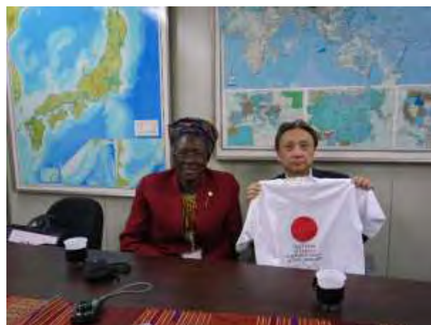
厚生労働省 麦谷 眞里 大臣官房審議官と