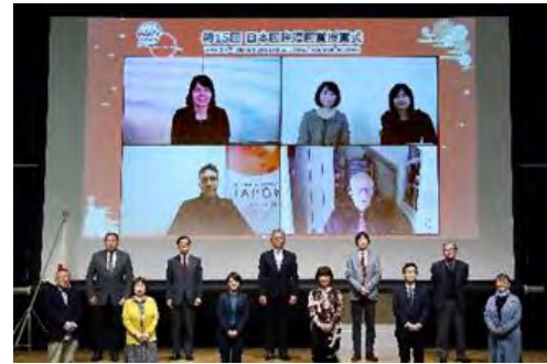
第15回日本国際漫画賞オンライン授賞式 (2022年3月4日)