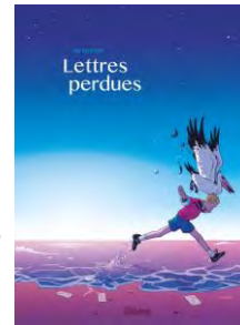
第16回優秀賞 『失われた手紙』 ジム・ピショップ(フランス)