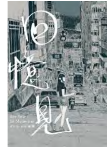
第16回優秀賞 『思い出で逢いましょう』 ペン・ソウ(香港)