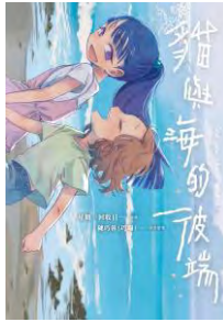
第16回優秀賞 『ネコと海の彼方』 漫画:シンチーイーホイ シヨウリーマンデーリカ パー 原作:陳巧蓉(台湾)