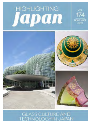
11月：日本におけるガラスの文化と技術(ビジュアル版)