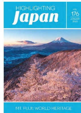
1月：世界遺産「富士山」(ビジュアル版)