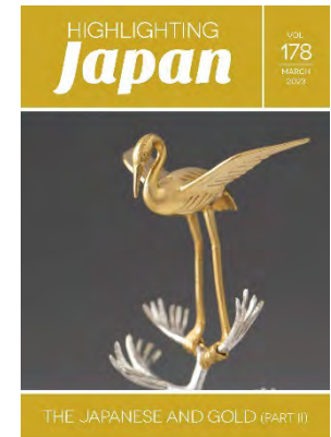
3月：黄金の国 日本(その2) (ビジュアル版)