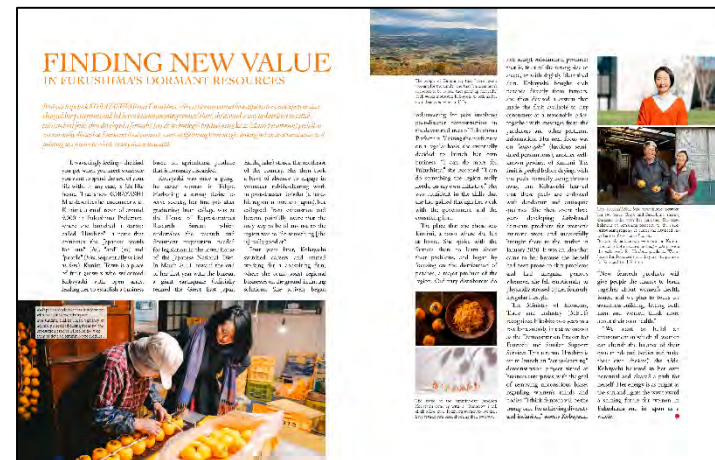
福島と東京を拠点に活動する フェムテック起業家に関する記事