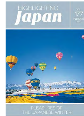
2月：日本の冬のたのしみ