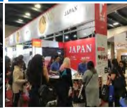
海外見本市出展支援