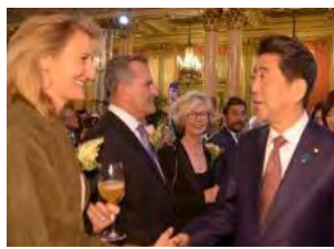
総理によるトップセールス