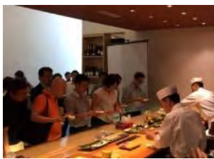
日本産食材サポーター店との連携

【お問い合わせ先】食料産業局海外市場開拓・食文化課 (03-3502-3408)