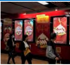
駅でのパネル広告