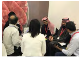
日本産和牛の商談