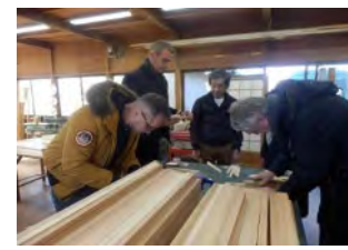
木材のバイヤー招へい