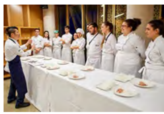
海外料理学校との連携