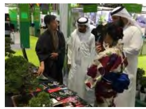
日本産花きの総合展示・PR