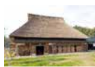
古民家を活用した宿泊施設