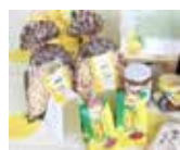
地域の特産品の開発