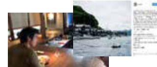
海外の有名タレントを活用した動画（LiTV）の撮影