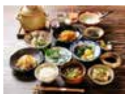
地域の食材を活用したメニュー作り