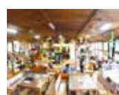
廃校を改修した体験施設