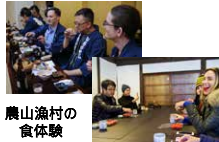
農山漁村の食体験