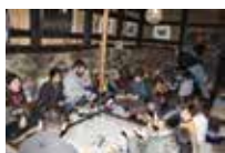
インバウンドに対応した体験メニューの開発