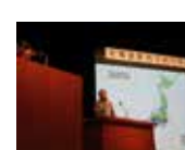
農泊シンポジウムの開催