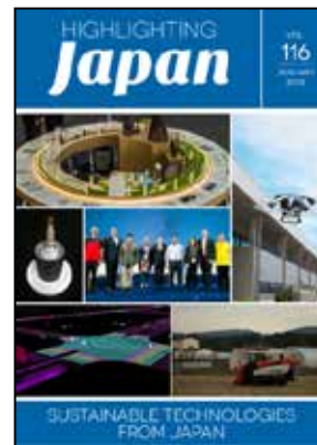
2018年1月： 持続可能な未来に向けた 科学技術