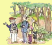
ガイド等の能力向上