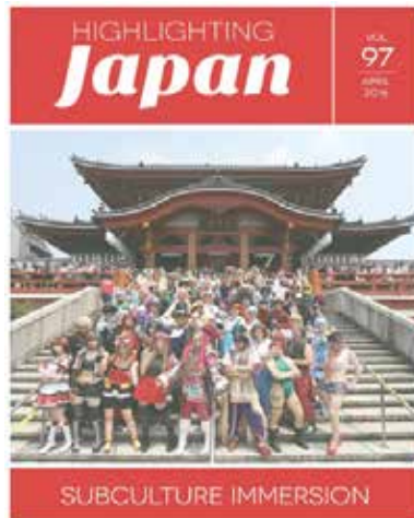
2016年4月： 日本のサブカルチャー