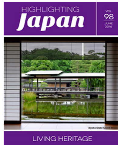
2016年6月： 文化財建造物の活用