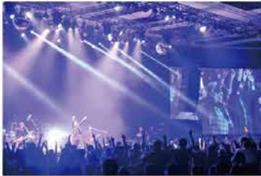
東京スカパラダイスオーケストラ JAPAN NIGHT in Jakarta @ The Kasablanka 2015年4月4日