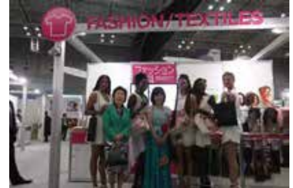
（ヘアウィッグ製品のブースを視察）