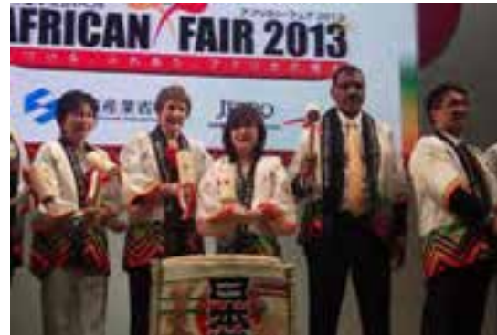
（アフリカ各国首脳と鏡割りに参加）