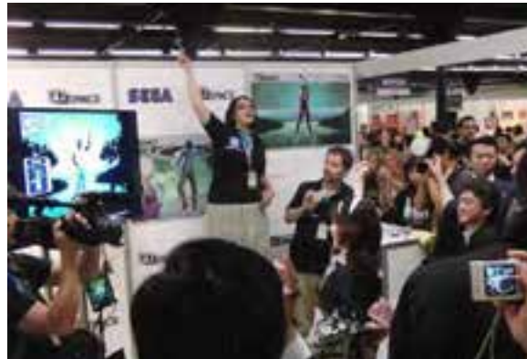
(着物でゲームを体験)