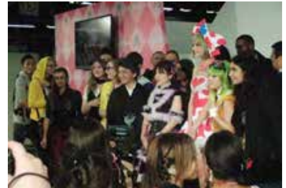
(ゴスロリ衣装で記念撮影、多くの来場者、記者に囲まれる。)