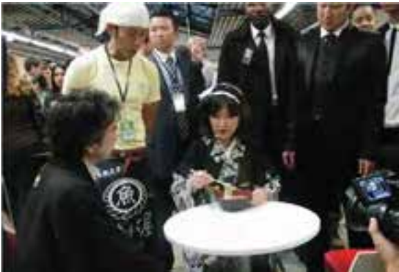
(着物でラーメンを試食)

Tokyo Crazy Kawaii Paris(※)を視察するとともに、この機会を活用して食やファッションなどの日本の魅力を発信するため、和装・洋装で、日本食の試食や新作ゲームのデモンストレーションなどを実施。本イベントは、初めての開催にも関わらず3日間で合計2万人の来場者があり、約10億円の広告効果。