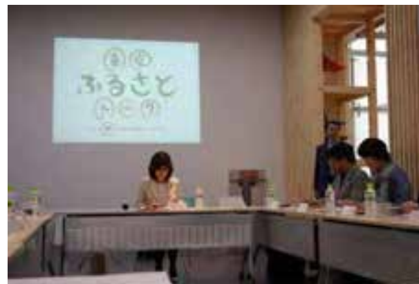
(参加者からの意見の様子)