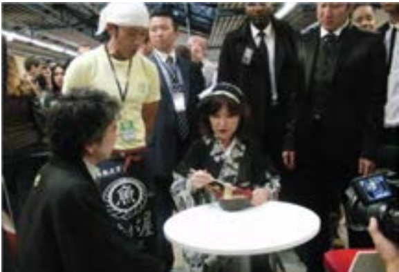
(着物でラーメンを試食)

Tokyo Crazy Kawaii Paris(※)を視察するとともに、この機会を活用して食やファッションなどの日本の魅力を発信するため、和装・洋装で、日本食の試食や新作ゲームのデモンストレーションなどを実施。本イベントは、初めての開催にも関わらず3日間で合計2万人の来場者があり、約10億円の広告効果。