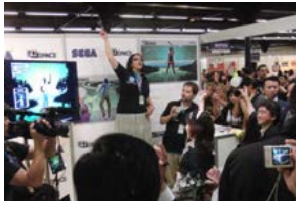
(着物でゲームを体験)