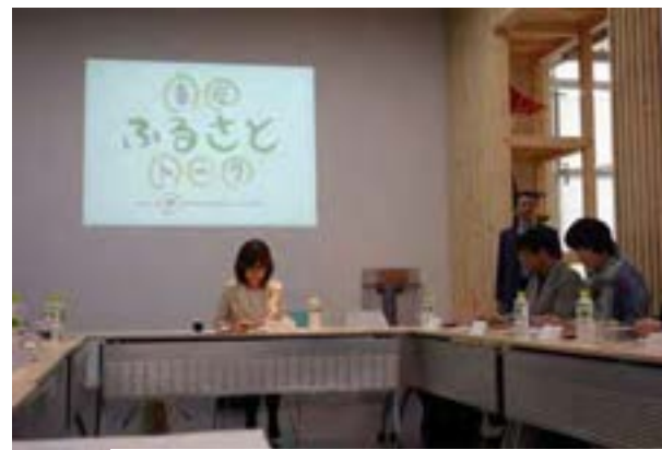
(参加者からの意見の様子)