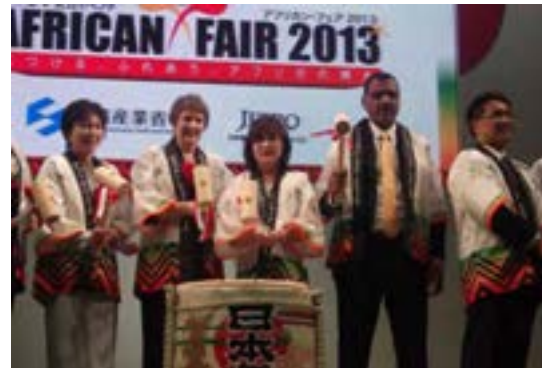
（アフリカ各国首脳と鏡割りに参加）