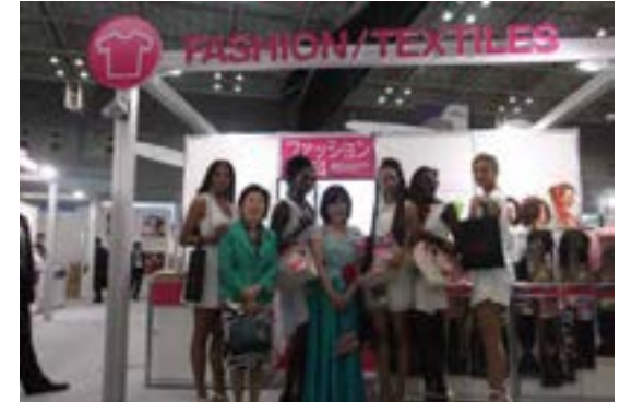
（ヘアウィッグ製品のブースを視察）