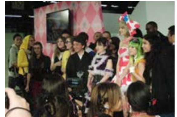
(ゴスロリ衣装で記念撮影、多くの来場者、記者に囲まれる。)