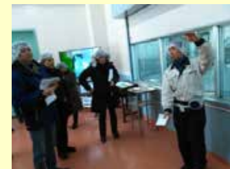
WSETロンドン校との連携 (平成27年11月-平成28年1月)