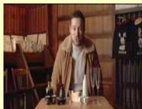
SEEKING PERFECTION (平成29年4、5月放映)