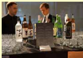
国連総会時レセプション (平成28年9月)