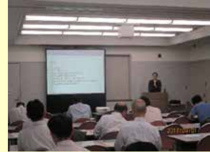
（写真）千葉会場の様子

・日本産酒類の輸出の現状や各国の輸入規制、必要な手続など日本産酒類の輸出に特化した内容のセミナーを国内7ヵ所を実施。