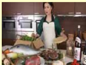
Secrets behind Japan's Water (平成28年6、7月放映)