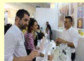
リオオリンピック・パラリンピック(平成28年8月)