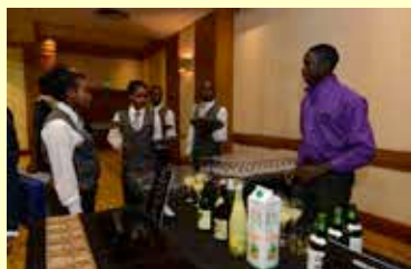
TICAD VI レセプション (平成28年8月)

国連総会(平成26年、27年、28年、29年ニューヨーク)、TICAD VI(平成28年ケニア)といった国際会議の場において、日本食文化とともに日本酒のPRを実施。