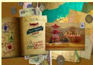
ルディ・マクサの世界 (平成28年6月放映)

また、日本産の米、牛肉、水産物、茶、日本酒の60秒の品目別CMを制作し、CNN等で放送。(平成29年)