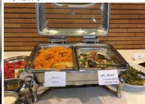
昼食、夕食はバイキング形式で宿泊しているホテルで一般客にも提供