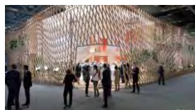
トーク・ワークショップ等