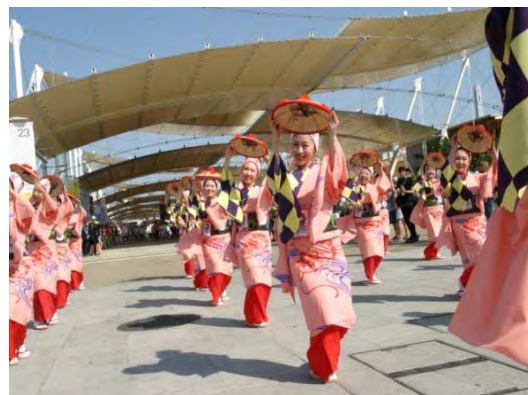
イタリア 「東北復興祭りパレード in ミラノ万博」 (平成27年7月)

ミラノ万博で開催されるナショナルデー「ジャパンデー」において、東北の10祭り(県都6祭りと福島地域の4祭り)と日本を代表するキャラクターによるパレードを実施。推定7万人が観覧。