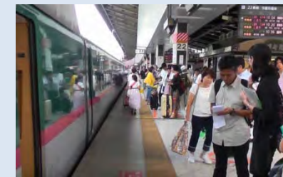
インドネシア, テンボ紙記者 東京駅プラットフォームでの 新幹線取材【外国報道関係者招へい】