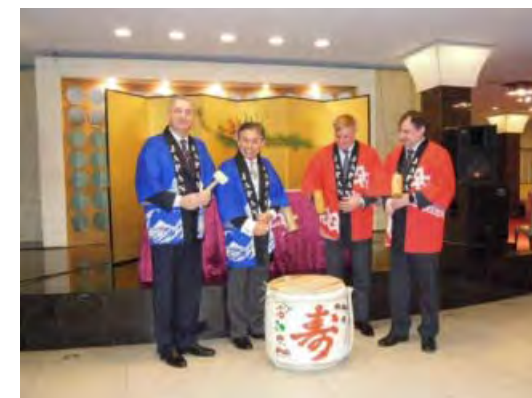
ロシア 「天皇誕生日祝賀レセプションでの鏡開き」 (平成27年12月)

「在外公館のレセプション」や大規模行事等の際に、鏡開きのパフォーマンスを実施したり、乾杯に使用するなど、日本の文化的側面の紹介と併せ、日本産酒類を積極的にアピール。