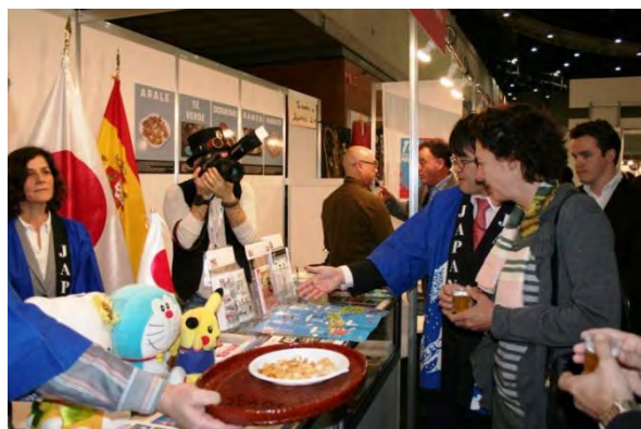
スペイン 「エキスポ・マンガ」 (平成28年5月)

「エキスポ・マンガ」はマドリッドで毎年開催。大規模マンガ・フェアとして多くのマンガ・アニメ、日本文化の愛好家を集める。日本のアニメの聖地を案内するアニメマップ(JNTO作成)や日本の観光案内パンフレットも配布し、観光広報と連携。