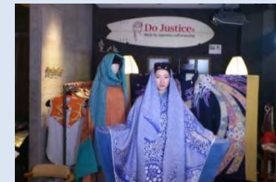
サウジチャンネル2 日本の着物生地を用いて サウジの伝統衣装アバヤを制作する ファッションデザイナーを取材 【テレビチーム招へい】