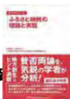
ふるさと納税の理論と実