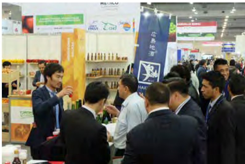
メキシコ最大級の食の展示会にて、 広島県呉市の酒・味噌を紹介