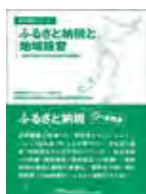
ふるさと納税と地域経営

ふるさと納税・地方創生研究会主催 / 書籍発行 鳥取県知事、飯田市長、学識者、総務省（オブザーバー） 参加