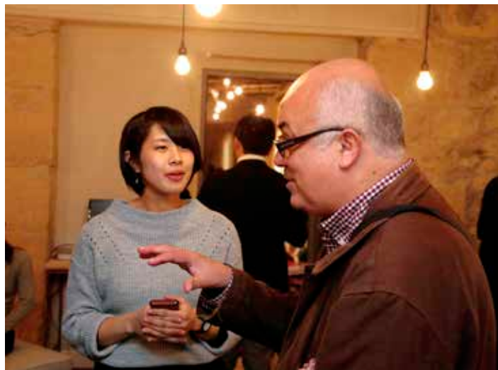
フランス・パリにて現地バイヤーとの意見交換