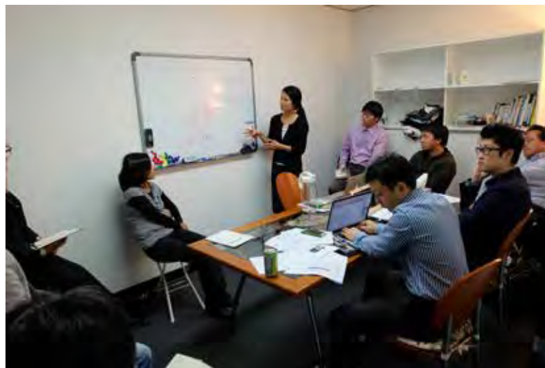
アメリカ・ロサンゼルスにて、 研修生が米国進出を希望する民間企業・OJT受入先と議論