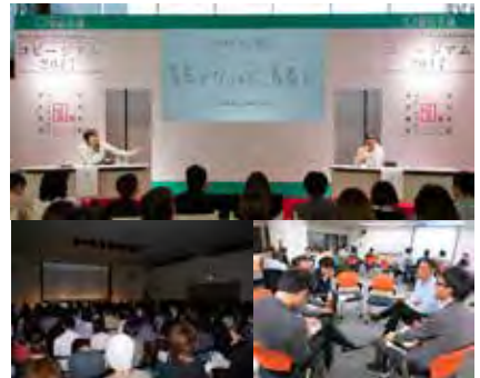
< 出版事業 >

< 教育事業 > コピーライター養成講座60周年 全国年間200テーマ 毎年20,000人の修了生