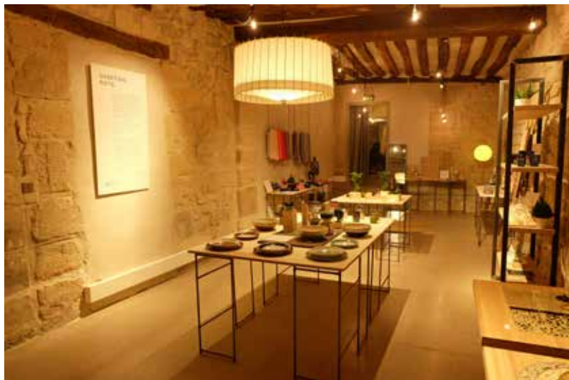
フランス・パリに展示する伝統工芸品の検討・展示