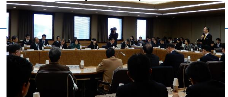
とくしま消費者見守りネットワーク 設立会議