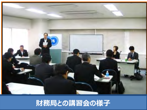
財務局との講習会の様子

未成年者の飲酒・喫煙防止のために様々な対策を検討する中で 財務局や警察本部のご協力のもと「たばこ講習会」を開催しました。