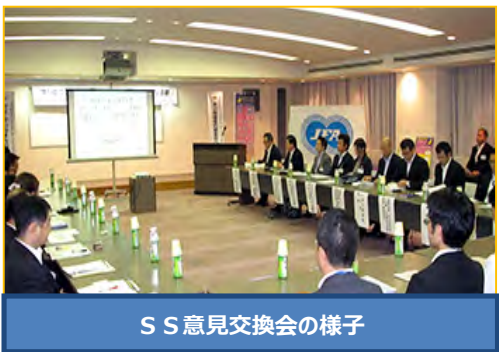
SS意見交換会の様子

SS活動を各地域でさらに強化するため「意見交換会」を開催しています。 平成28年に北九州市で開催された意見交換会で採択された 「チェーンの垣根を越えた合同防犯訓練」を実施しました。