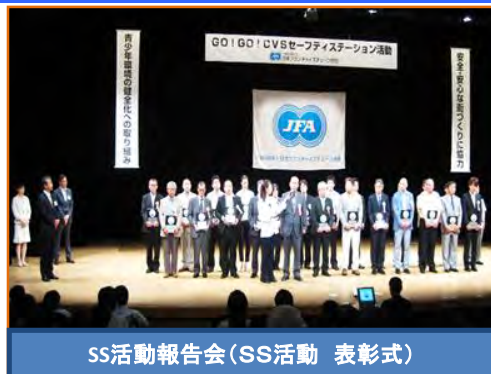
SS活動報告会(SS活動 表彰式)