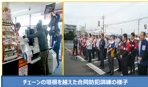
チェーンの垣根を越えた合同防犯訓練の様子