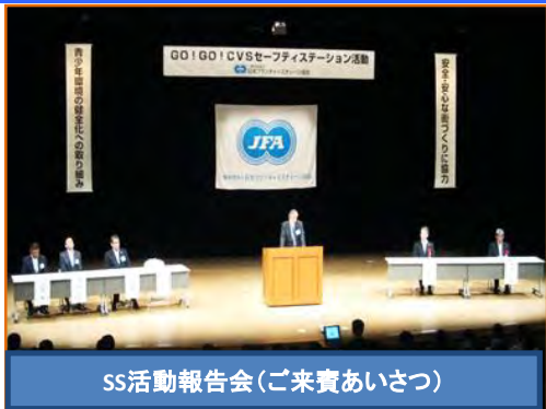
SS活動報告会(ご来賓あいさつ)

加盟店の経営者や従業員に向けた「報告会」を行なっています。 活動内容のアンケート調査結果の報告や好事例店舗表彰を行ない 活動のさらなる深耕を図っています。