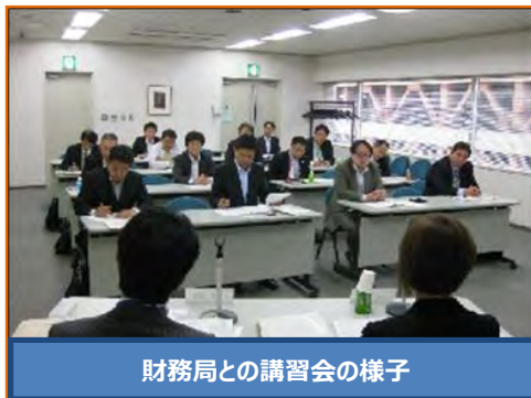
財務局との講習会の様子