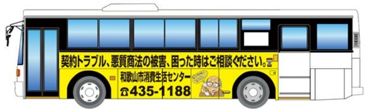
ラッピングバス広告（一例）