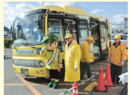
みどりっこバスとみどりっこちゃん