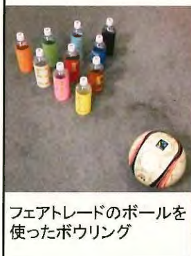
フェアトレードのボールを使ったボウリング