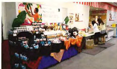
フェアトレードの糸を使ったミサンガ