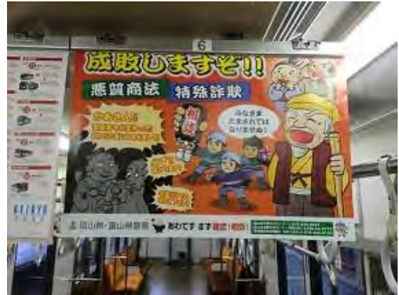
富山地方鉄道 (H27. 7～)