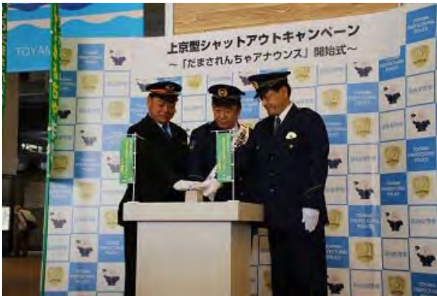
J R西日本金沢支社 (H27. 5～)