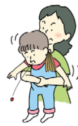
ハイムリック法 (年長児)

乳児に対しては、手当をする人の片腕に、子をうつぶせに乗せ、手のひらで顔を支えて、少し大きい子に対しては、手当をする人の立て膝で太ももがうつぶせにした子のみぞおちを圧迫するように乗せて、どちらも頭を体より低くして、背中まん中を平手で異物が取れるまで叩きます。