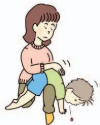
背部叩打法変法 (少し大きい子)

乳児に対しては、手当をする人の片腕に、子をうつぶせに乗せ、手のひらで顔を支えて、少し大きい子に対しては、手当をする人の立て膝で太ももがうつぶせにした子のみぞおちを圧迫するように乗せて、どちらも頭を体より低くして、背中まん中を平手で異物が取れるまで叩きます。