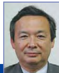
長田 敏 独立行政法人製品評価技術基盤機構 (NITE)製品安全センター参事官