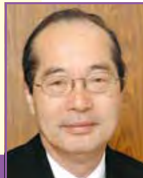
向殿政男 明治大学理工学部 情報科学科、新領域創造専攻安全学系 教授 ◎基調講演モデレーター