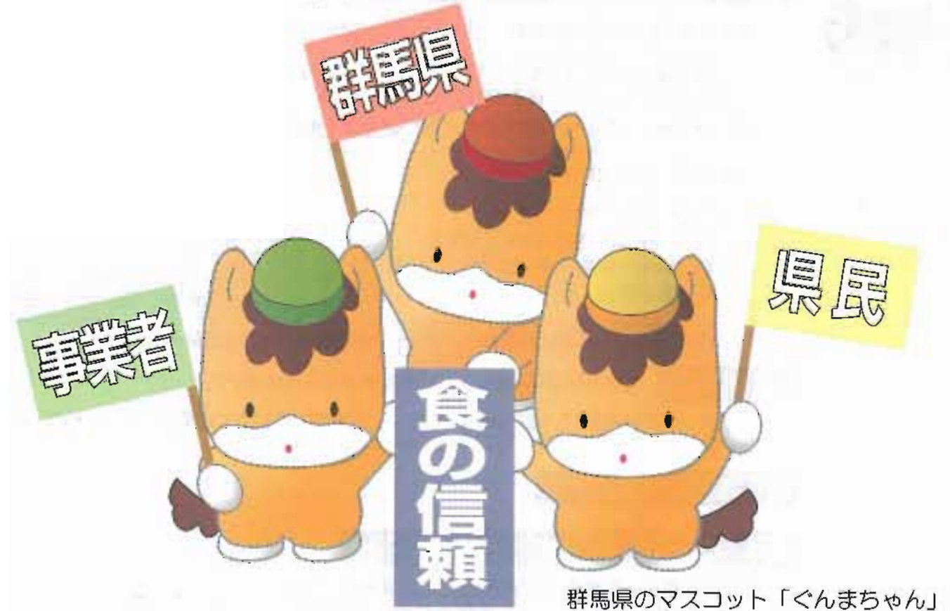
群馬県のマスコット「ぐんまちゃん」

食品等回収情報提供システムは、食品関係事業者が自主回収に着手した際、群馬県ホームページをとおして、自主回収情報を提供するためのしくみです。