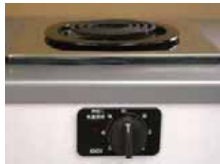
一口こんろ (前面操作) ※写真は富士工業製

身体や物が接触し、意図せずスイッチが「入」となる可能性がある構造であったために、電気こんろの上や周囲に可燃物が置かれていて、火災事故に至る危険性があります。