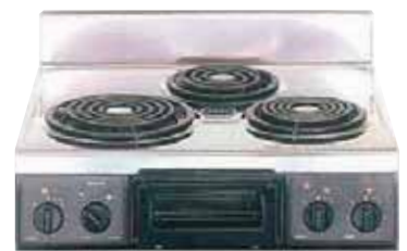
複数口こんろ (前面操作のみ)