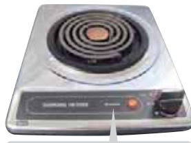
ブランド表示はHITACHIまたは、SUNWAVE