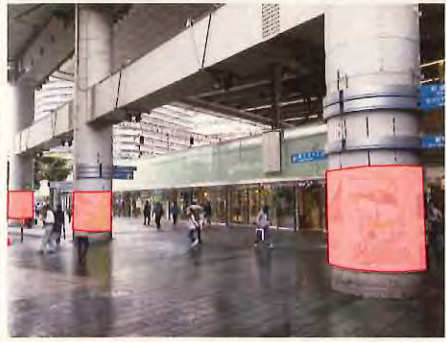
【イメージ写真】 モノレール支柱 (巻き広告)