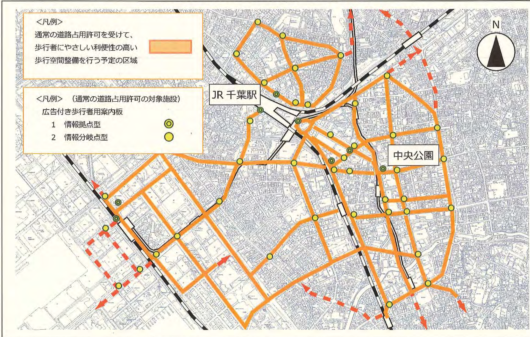
制度を活用して整備・設置する施設等の配置を示す地図