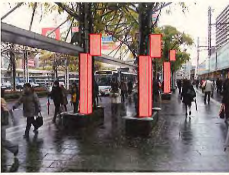
【イメージ写真】 パーゴラ (藤棚) 支柱 (巻き広告・バナー広告)