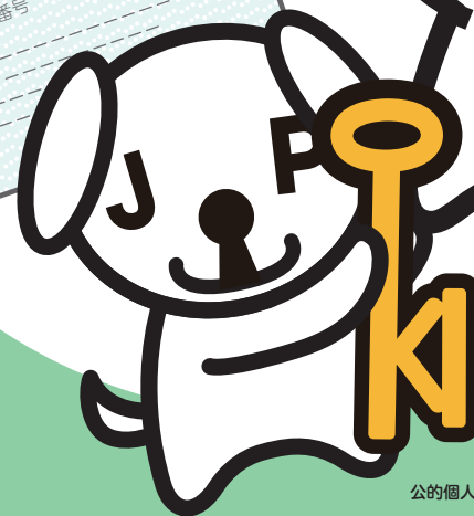
マイナンバーPRキャラクター マイナちゃん