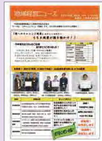
提案の成果を周知する庁内広報紙