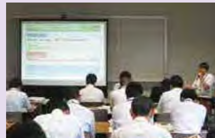
【内閣府研修講師派遣の様子】