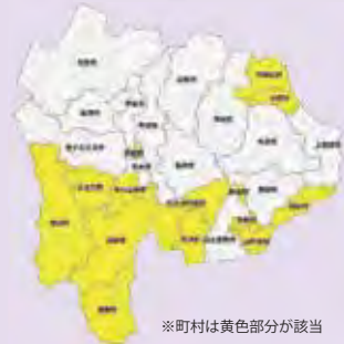
※町村は黄色部分が該当