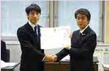
市長(写真右)が職員(写真左)を表彰