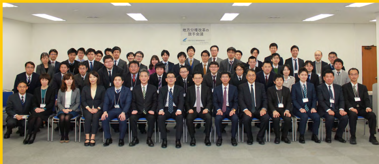
会議終了後の集合写真