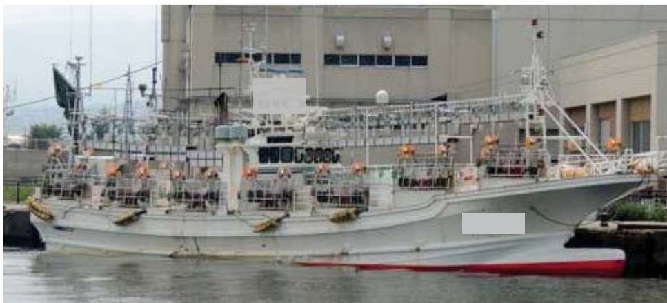
小型いかつり漁船